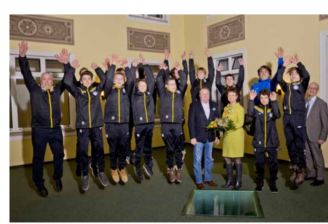
Spielvereinigung Kranichfeld 1861 e.V.