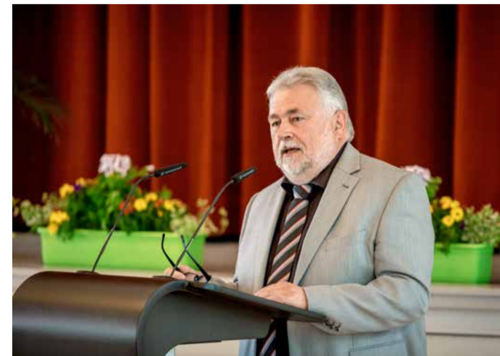
Festredner Landrat Hans-Helmut Münchberg