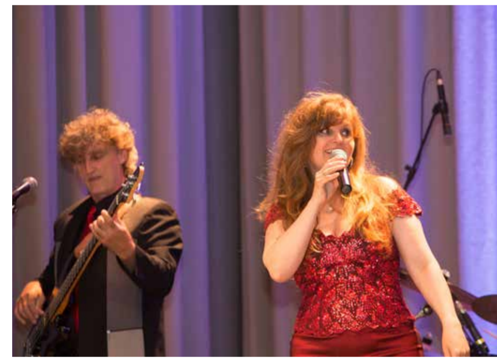
Feier für die Mitarbeiter mit Livemusik