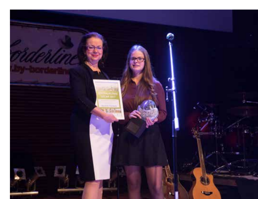
Die Verleihung des ersten »Zentralklinik-Oscar«