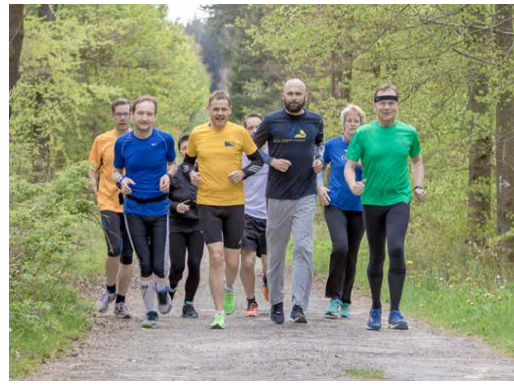
RUN-Training mit 800-Meter-Olympiasieger Nils Schumann