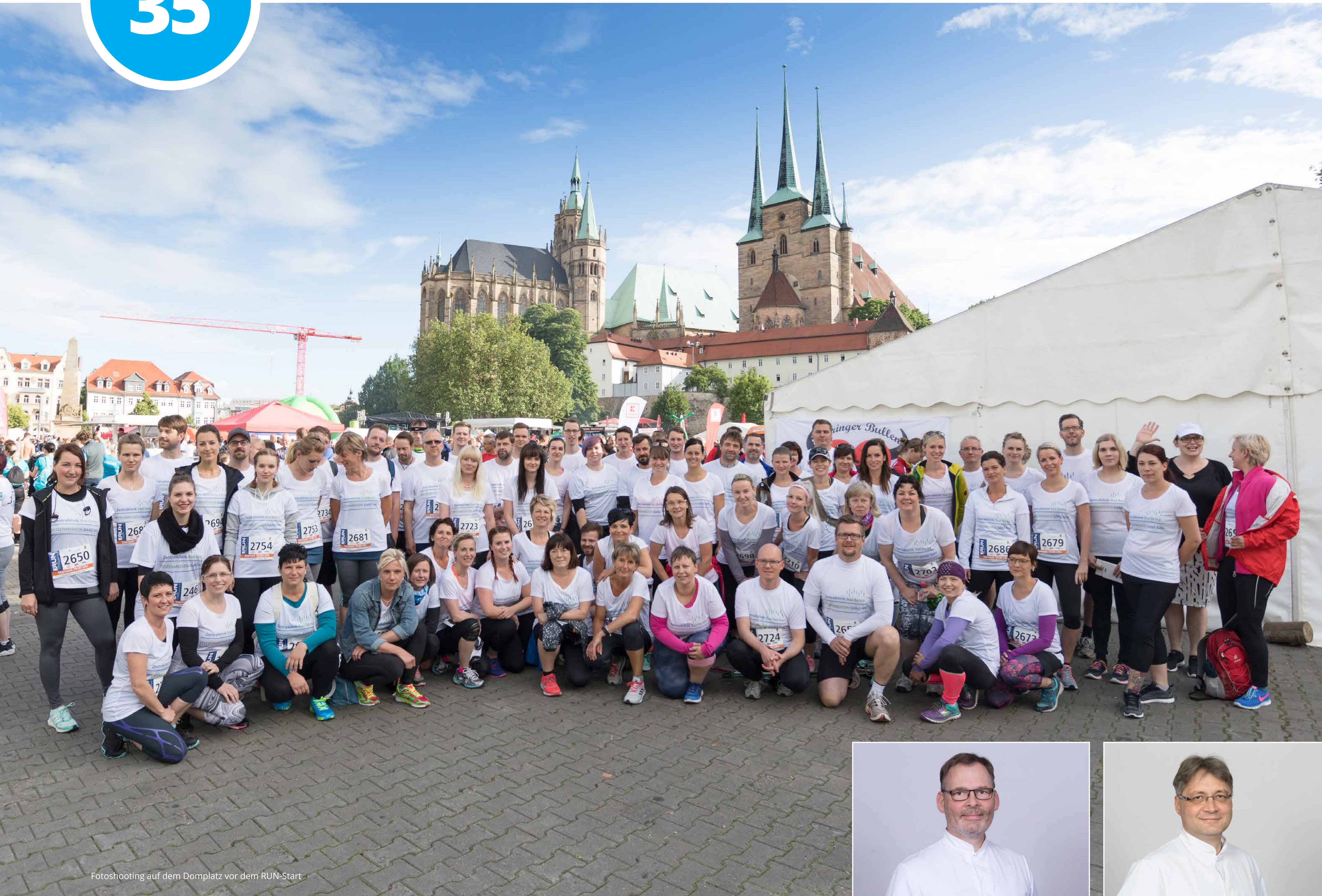
Fotostooting auf dem Domplatz vor dem RUN-Start