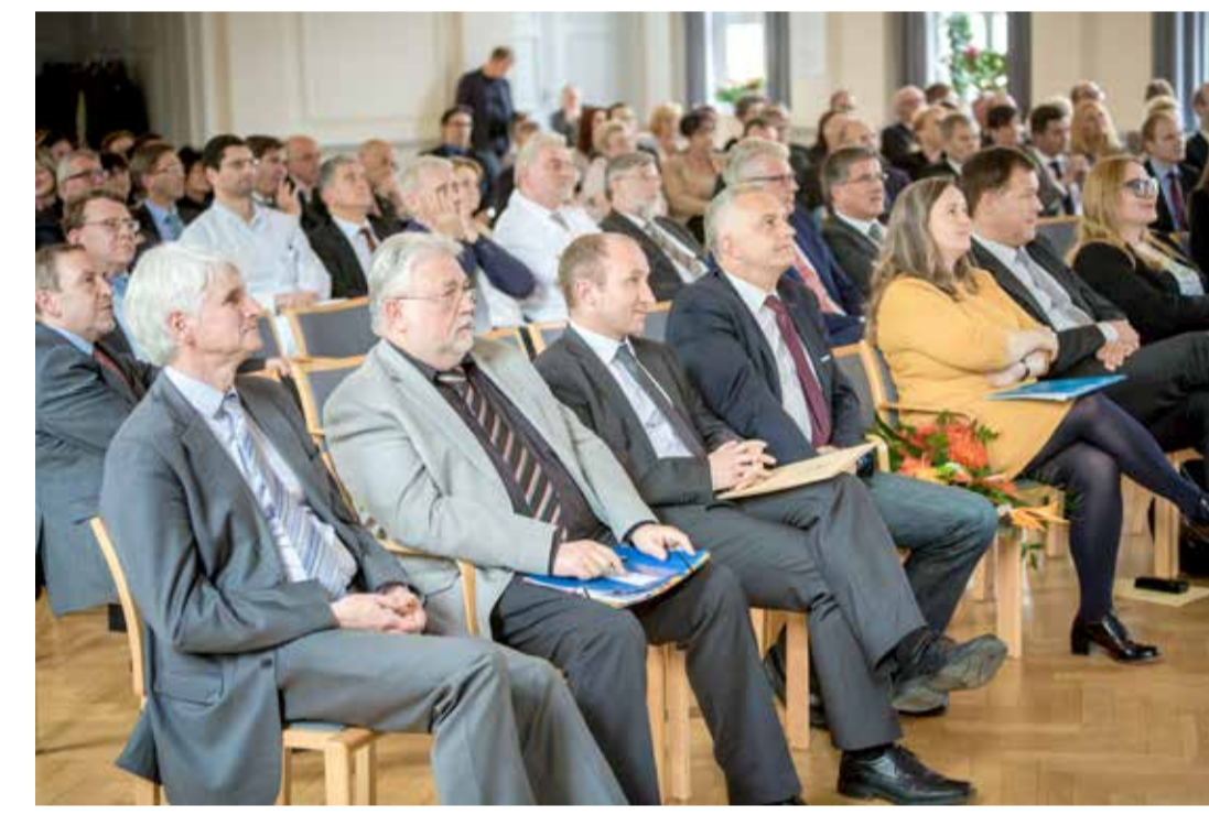
Blick in den Kultursaal.