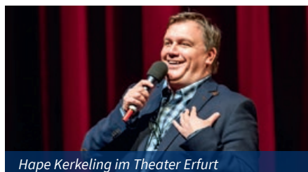
Hape Kerkeling im Theater Erfurt