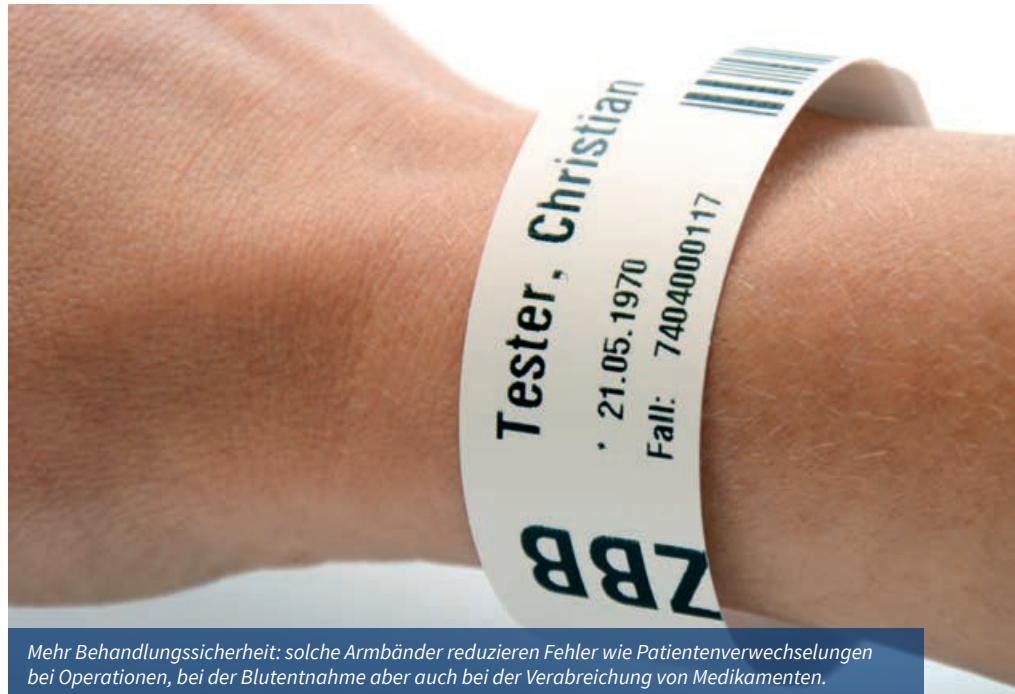
Mehr Behandlungssicherheit: solche Armbänder reduzieren Fehler wie Patientenverwechslungen bei Operationen, bei der Blutentnahme aber auch bei der Verabreichung von Medikamenten.

Doch bis dahin wird es noch dauern. Bisher konnten die mit der Gesundheitskarte verbundenen und von der Politik gesetzten Termine noch nie in der Praxis eingehalten werden. Bevor sich Dr. Berger wirklich über einen geringeren Aufwand bei der Medikamenten-Anamnese