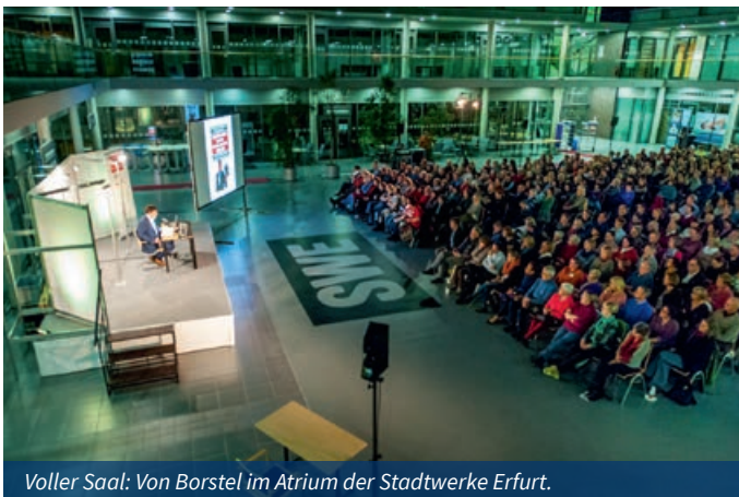
Voller Saal: Von Borstel im Atrium der Stadtwerke Erfurt.