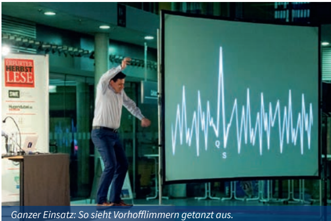
Ganzer Einsatz: So sieht Vorhofflimmern getanzt aus.