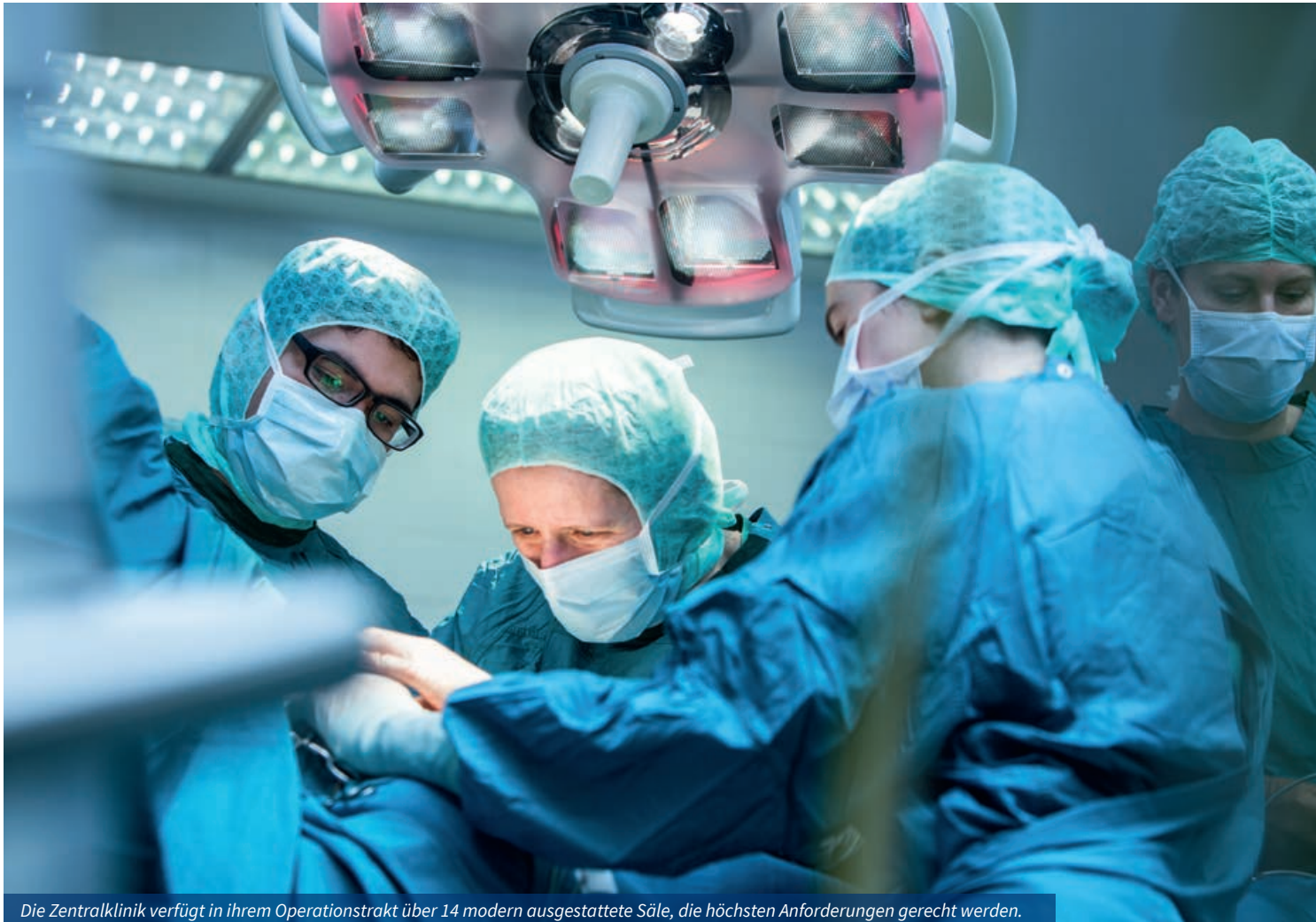
Die Zentralklinik verfügt in ihrem Operationstrakt über 14 modern ausgestattete Säle, die höchsten Anforderungen gerecht werden.

Die Klinik für Anästhesie und Intensivmedizin ist wesentlich in die Versorgung polytraumatisierter sowie vital bedrohter neurologischer und kardiologischer Patienten in der zentralen Notaufnahme des Klinikums eingebunden. Die Zentralklinik Bad Berka ist Standort des einzigen Intensivtransporthubschraubers Thüringens (ca. 1.000 Einsätze / Jahr). Viele Kollegen sind zudem im bodengebundenen Notarztdienst der Region tätig.